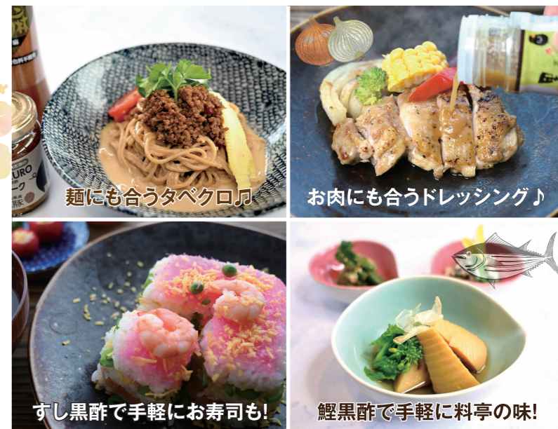
麺にも合うタベクロ月